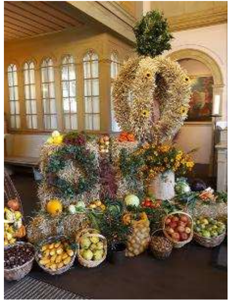
Festlich geschmückter Altarraum 2022

Übrigens: Erntespenden zum Schmücken des Altars werden am Samstag, dem 30. September vormittags bis 13 Uhr vor dem Haupteingang unserer Kirche angenommen.