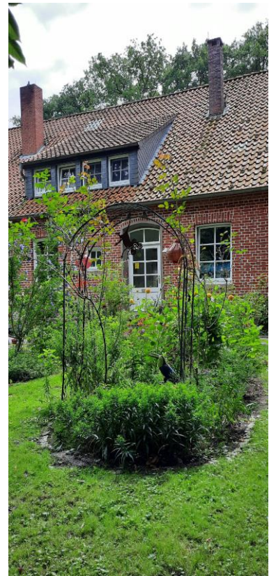
Pfarrhaus mit dazugehörigem Garten

Die Lukaskirche liegt im Zentrum der Ortschaft. Unsere Gemeinde verfügt über ein modernisiertes Pastorenwohnhaus mit integriertem Pfarrbüro. Zur Pastorenwohnung gehört ein separater Garten, der nicht von der Vorderseite des Grundstücks aus einsehbar ist. Das Gesamtgebäude umfasst ein Gemeindehaus mit mehreren Tagungsräumen und zeitgemäß ausgestatteten Sozialräumen.