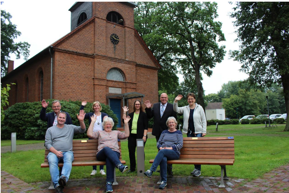
Der Kirchenvorstand vor der Lukaskirche in Posthausen